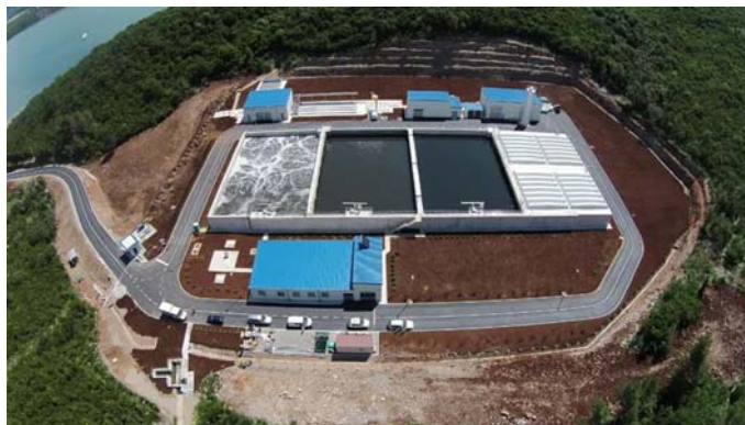
PPOV za opštine Kotor i Tivat

Početak mjeseca jula, tačnije 09.07.2019. godine, održan je pregovarački sastanak sa Izvođačem (WTE) na teme, produženja pružanja usluga nakon 31.08.2019. godine, kao i obuci osoblja, čije se zapošljavanje očekuje najkasnije u septembru. Na sastanku je dogovoreno da Izvođač dostavi finansijsku ponudu Investitorima, koja će obuhvatati nastavak upravljanja i održavanja postrojenja nakon 31.08.2019. godine, u trajanju od 6 mjeseci obavezno, plus 6 mjeseci opciono. Nakon dobijanja finansijske ponude, organizovaće se sljedeći pregovarački sastanak, na kojem će se definisati prava i obaveze obje strane. Kako su budžetom predviđena sredstva za odvoženje mulja iscrpljena u prethodnom periodu, pojavio se problem finansiranja odvoženja mulja sa postrojenja, kao i angažovanje eksterne laboratorije tokom četvrte kampanje testiranja. Na pomenutom sastanku, Izvođač je prihvatio da preuzme obavezu odvoženja mulja, nezavisno od procenta suve materije, dok će fakturu za odvoženje mulja ispostaviti Investitorima kroz privremenu situaciju. Rezultati treće kampanje „testiranja po završetku“ su dostavljeni 16.07.2019. godine i testiranje je ocijenjeno kao uspješno. Četvrta kampanja „testiranja po završetku“ je otpočela 01.07.2019. godine i trajaće 42 dana, do 11.08.2019. godine.