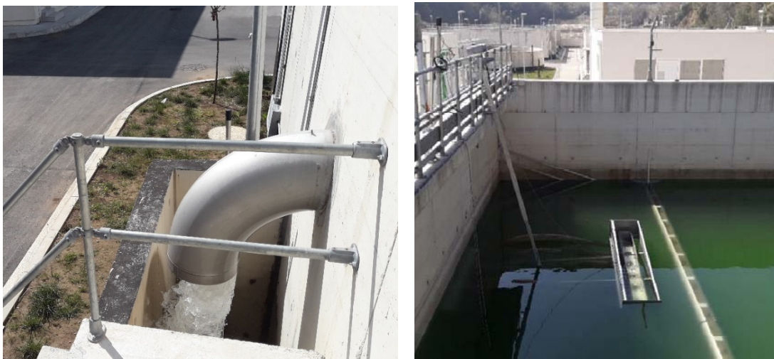
PPOV Herceg Novi