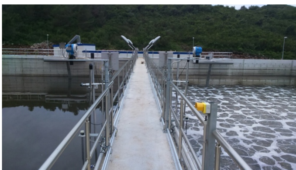
PPOV za opštine Kotor i Tivat