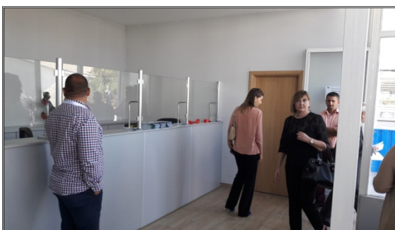
Otvaranje Korisničkog servisa ViK-a Ulcinj