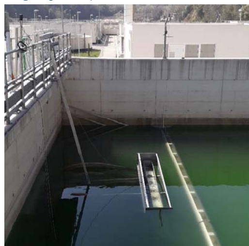
PPOV Herceg Novi