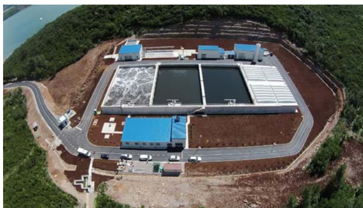
PPOV za opštine Kotor i Tivat

Kako je Nadzorni Inženjer u svom dopisu od 23.03.2017. godine upozorio Investitora na potrebu preciziranja broja i načina testiranja po završetku radova Investitori (ViK Kotor i ViK Tivat) su zajedničkom potpisanim izjavom obavijestili Nadzornog inženjera o svom stavu. Nakon konsultacije sa svojim osnivačima (Opština Tivat i Opština Kotor), Investitori su obavijestili Nadzornog inženjera u pisanoj formi da oslobađaju Izvođača obaveze da dokaže parametre postrojenja na osnovu četiri testiranja i prihvata rezultate tri ili manje testiranja, imajući pri tom u vidu da smanjenje broja testiranja smanjuje nivo kontrole kvaliteta funkcionisanja postrojenja. Nadzorni Inženjer je, u skladu sa Investitorovim dopisom, dana 27.04.2017. godine uputio instrukciju Izvođaču vezano za njegove obaveze oko testiranja po završetku radova.