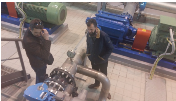
Studijska posjeta – Korča, Albanija